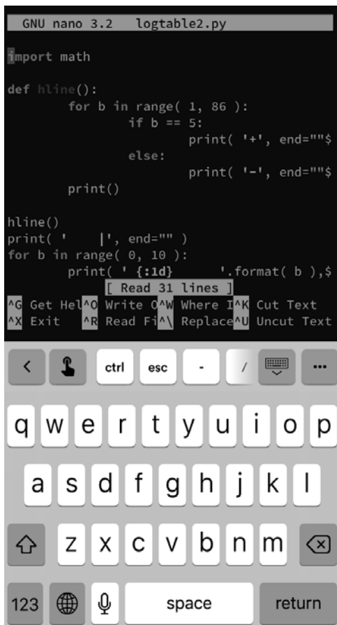
図2 本システムを用いた Python プログラミング

プラスチックケースに収めた Raspberry Pi Zero WH をモバイルバッテリーで稼働し、学習用端末である Apple iPod touch から無線 LAN ルータを介して Termius でログインし、GNU nano エディタで Python プログラムを編集している状態である。なお、無線 LAN ルータはこの図には写っていない。図3は利用者のターミナルソフトウェア (Termius) における Python 言語のプログラム (常用対数表の作成) 編集中の iPod touch (iOS) のスクリーンショットである。学習者の端末として、このほか Windows の TeraTerm, macOS のターミナル, Android の Termius, iPad の Termius からのログインを確認した。いずれも、認証には端末に秘密鍵を設置した公開鍵認証を使用している。